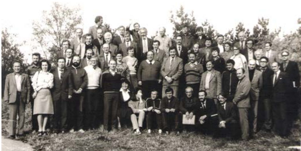
Судьи всесоюзной категории, прошедшие аттестацию в г. Киеве (1986 г.).

После перехода спортивного ориентирования в ведение Спорткомитета СССР детские экскурсионно-туристские станции в большинстве своем прекратили заниматься развитием этого вида спорта, используя лишь его прикладное значение в рамках туристских мероприятий. Прекратилось проведение всесоюзных и всероссийских соревнований среди школьников. Органы управления образованием стали возлагать руководство развитием ориентирования на немногочисленные детско-юношеские спортивные школы, которые были к этому не готовы, да и ориентирование в них, не являясь олимпийским видом, не могло соперничать с другими видами спорта. Вследствие этого в 1979-82 гг. массовая работа с юными ориентировщиками в стране была практически свернута. И только с 1983 года, когда Центральная детская экскурсионно-туристская станция Минпроса РСФСР снова взяла на себя функции организатора, ситуация стала выправляться. Возобновилось проведение крупных матчевых встреч, зимних и летних первенств РСФСР среди учащихся, что сти-