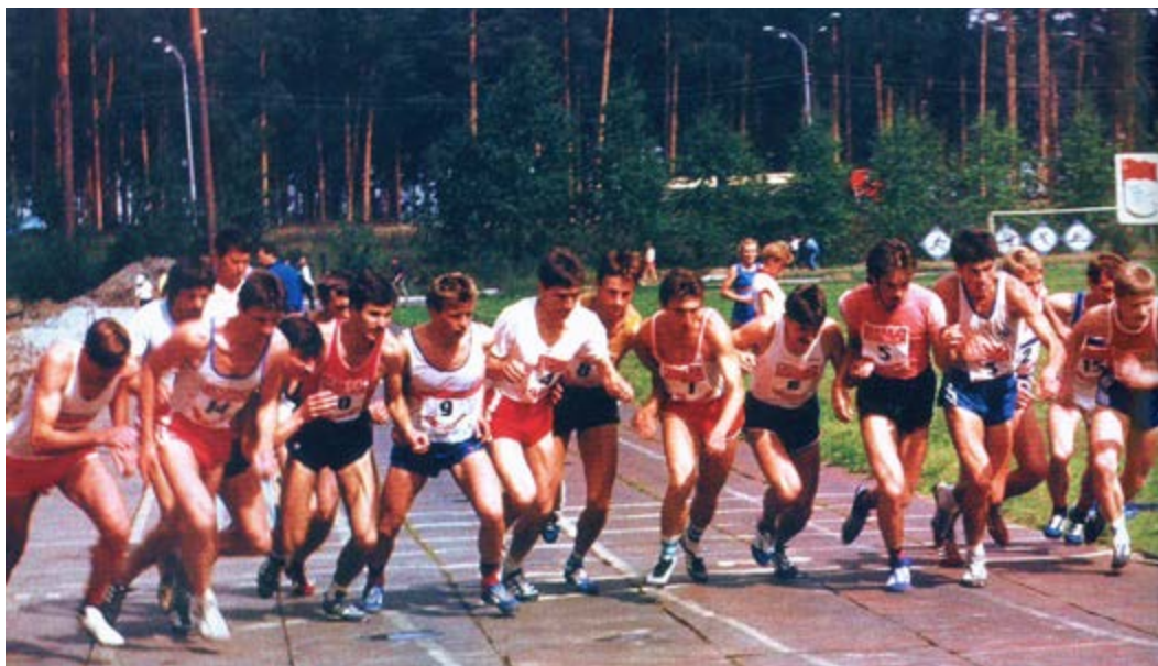
Сдача контрольных нормативов участниками VII чемпионата СССР (1987 г.)