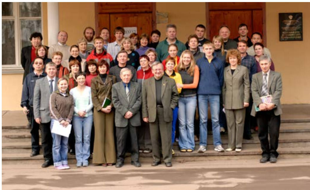
Участники всероссийского судейского семинара, 2009 год, г. Москва