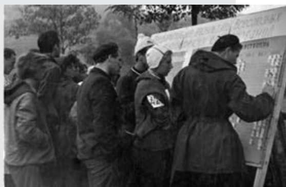
Карта и фотографии Первых Всесоюзных соревнований