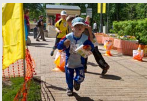
На дистанции массовых соревнований «Российский Азимут»