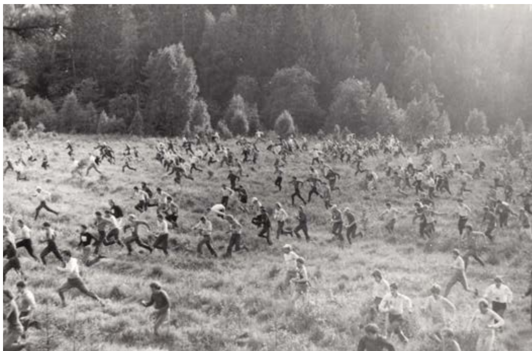
Старт одного из забегов на многодневке

С развитием ориентирования в СССР, с увеличением массовости соревнований все более отчетливо были видны наши