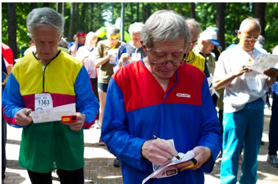
На соревнованиях ветеранов

В Чемпионате мира среди ветеранов по спортивному ориентированию бегом 2004