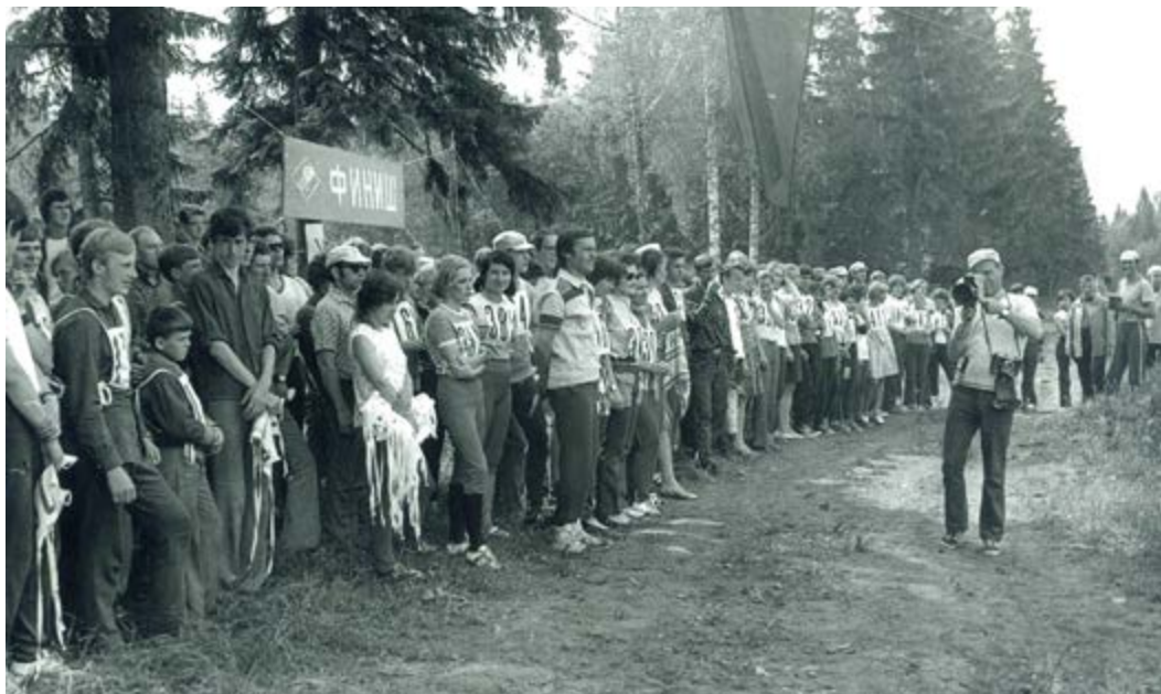
Типичная картина торжественного открытия соревнований

низовом звене – коллективе физкультур-ры, который участвовал как в территориальных соревнованиях, так и в своих ведомственных. В связи с этим спортсменам в самом низовом звене – коллективе, предоставлялась возможность принимать много стартов. В период конца 1960-х – середины 1970-х годов резко увеличилось количество соревнований в территориях, выросло число участников.