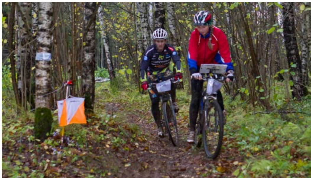
На соревнованиях по велоориентированию

Велоориентирование является ещё одним видом спортивного ориентирования, который не так давно начал отчёт своего самостоятельного существования в России. Первый официальный чемпионат страны по этому виду прошел в г. Москве в августе 1997 года. В 2004 году было проведено 8 этапов Кубка России по велоориентированию, в которых участвовало от 70 до 90 спортсменов. Сборная команда России стала участницей I чемпионата мира по этому виду, проходившем в 2002 году во Франции, а также чемпи-