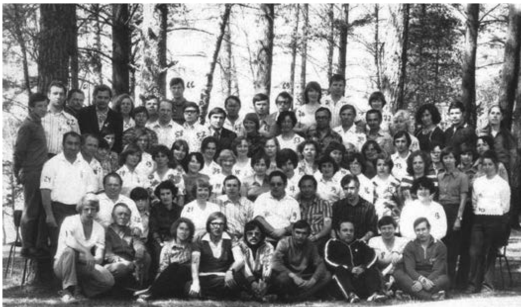
Участники Всесоюзного семинара судей, Алоль, 1978 год.

Существовала стройная система назначения главных судей и секретарей, инспекторов всех крупных соревнований, схема отчетности и разбора итогов соревнований, организации и проведения судейских семинаров. Была введена практика, когда судьей республиканской (СРК) или всесоюзной категории (СВК) нельзя было стать, не отсудив на ключевой должности соревнований республиканского или всесоюзного масштаба. Было признано необходимым для судей, претендующих на присвоение званий СРК или СВК, обязательное участие в организации и проведении областных, краевых, республиканских семинаров по подготовке судей. Все эти организационные меры позволили создать многочисленный