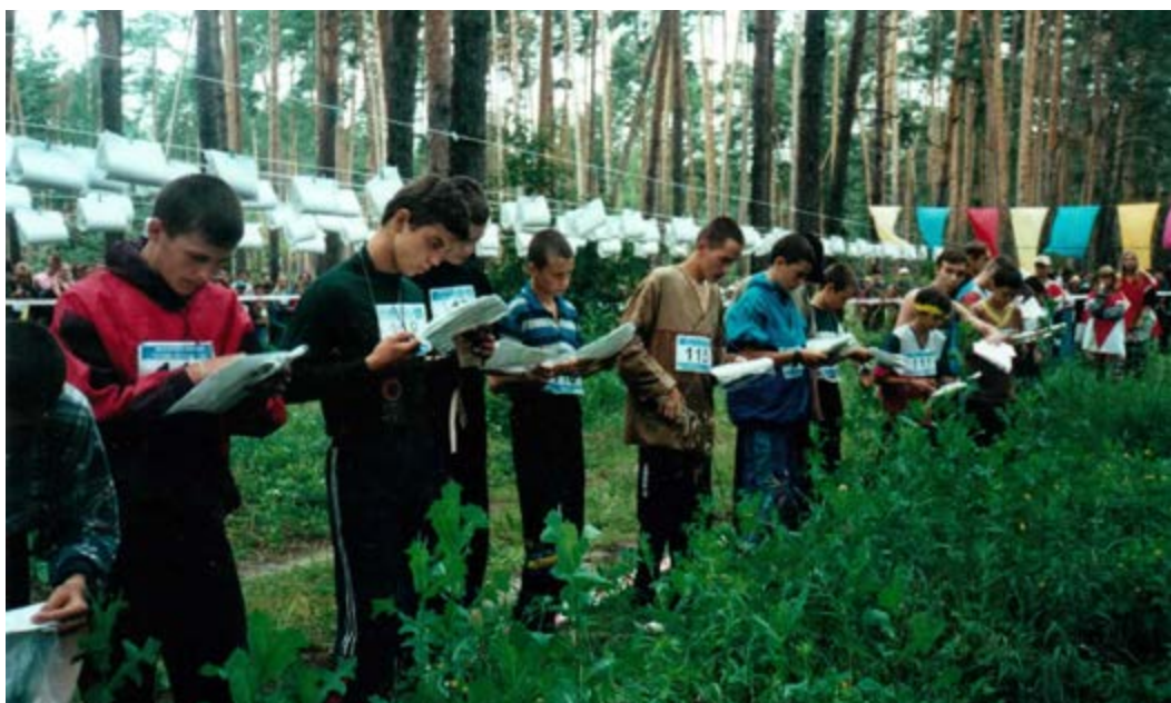
На старте забега в ориентировании по выбору среди школьников

В 1977 году Министерством просвещения, Спорткомитетом СССР, Центральным советом по туризму и экскурсиям была утверждена программа детско-юношеской школы (отделения) по ориентированию, подготовленная Ю. Константиновым и Б. Огородниковым. Тогда же Министерство просвещения СССР направило в органы образования письмо, рекомендуя открывать ДЮСШ и отделения по