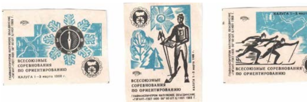
Этикетки спичек, выпущенных по случаю проведения I Всесоюзных зимних лично-командных соревнований

Возможность помериться силами с ведущими спортсменами планеты представилась нашим спортсменам на своеобразной репетиции чемпионата мира в 1969 году в ГДР. Результат нашей женской команды был неожиданным – 4-е место в эстафете и проигрыш в четыре секунды третьим призерам – норвежкам, чемпионкам мира 1968 года. Мужчины выступили слабее (8-е место), но, тем не менее, оставили позади 28 команд, в том числе вторые составы команд Швеции, Дании,